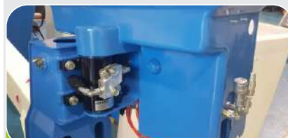
ROTACIÓN DE LA BARQUILLA