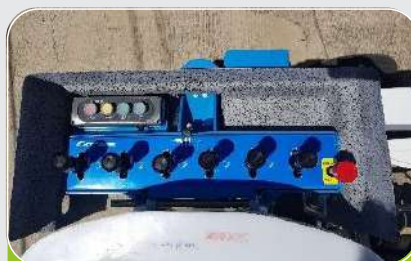
MANOBRAS INDEPENDIENTES COMANDOS SEPARADOS 110MM PARA FACILITAR LA UTILIZACIÓN CON GUANTES