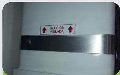
CLASE DE AISLAMIENTO B 69kV