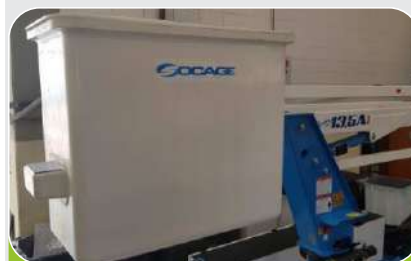
BARQUILLA BIPUESTO (2 EPERSONAS)

Clase de Aislamiento "C" 46Kv - "B" 69Kv