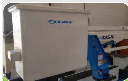
BARQUILLA BIPUESTO (2 personas)