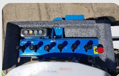
MANOBR INDEPENDIENTE COMANDOS SEPARADOS 110 mm PARA FACILITAR LA UTILIZIACIÓN CON GANTES