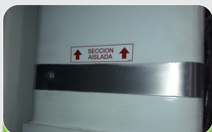
CLASE DE AISLAMIENTO B 69kV