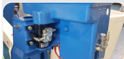
ROTACIÓN DE LA BARQUILLA